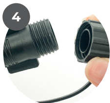
Placez le bouchon à vis sur la dernière lumière pour finir la chaîne