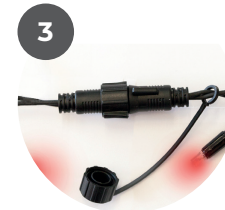
Alle weiteren, benötigten Lichtersets/Zubehör anschließen