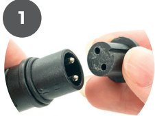
Enlevez les bouchons de sécurité de vos produits