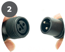
Connectez la prise à la première guirlande lumineuse / au premier accessoire