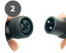
Anschlußkabel and erstes Produkt/Zubehör anschließen