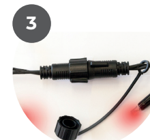
Continue connecting required lights / accessories