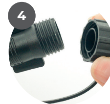
Befestigen Sie die Endschraubkappe am Ende der Lichterkette.