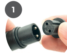
Remove the safety cap from product(s)