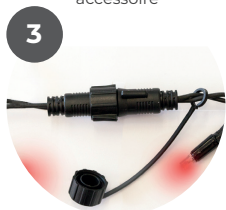
Continuez à connecter les guirlandes et accessoires